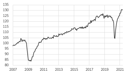
Indice du volume des échanges mondiaux (2010 = 100)