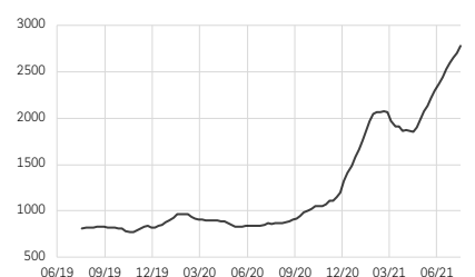
Indice du coût du fret maritime par containers en provenance de Chine