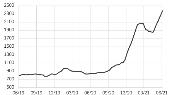
Indice du coût du fret maritime par containers en provenance de Chine