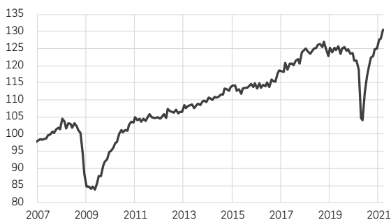
Indice du volume des échanges mondiaux (2010 = 100)