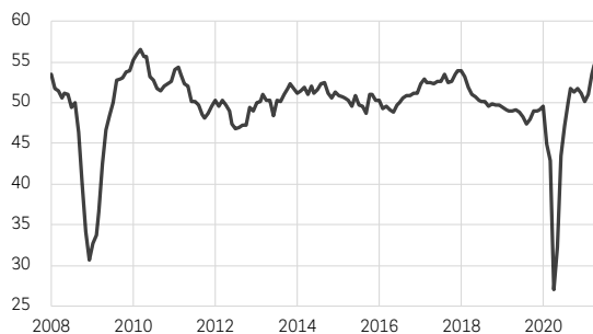
Indice PMI manufacturier global, nouvelles commandes à l'exportation