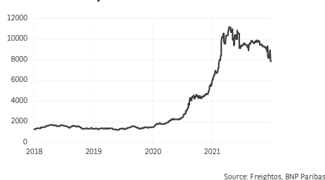
5. Indice du taux de fret