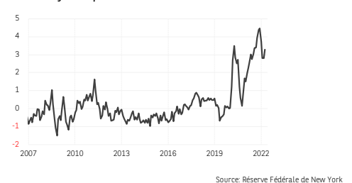
3. Indice synthétique de tensions sur les chaînes de valeur