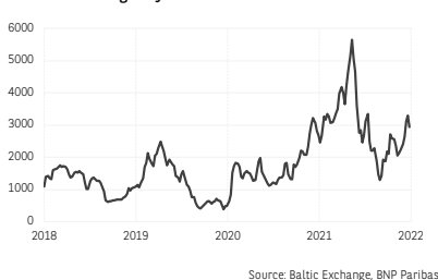
4. Baltic Exchange Dry Index