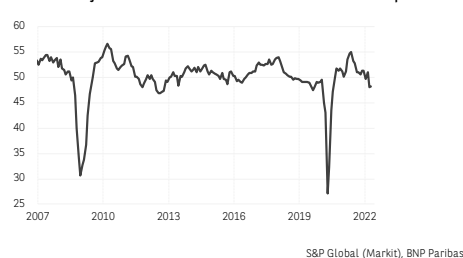
2. PMI manufacturier mondial - Nouvelles commandes à l'exportation