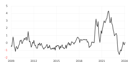
3. Indice synthétique de tensions sur les chaînes de valeur