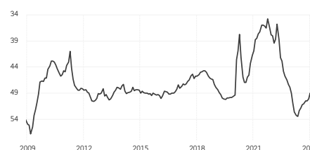
6. PMI manufacturier mondial Délais de livraison (échelle inversée)