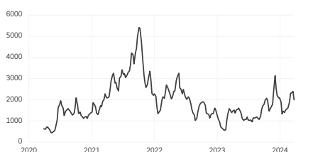
4. Baltic Exchange Dry Index