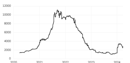
5. Indice du taux de fret