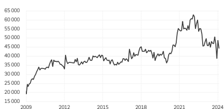
1. Nouvelles commandes à l'exportation en provenance de Taiwan (USD milliard, cvs)