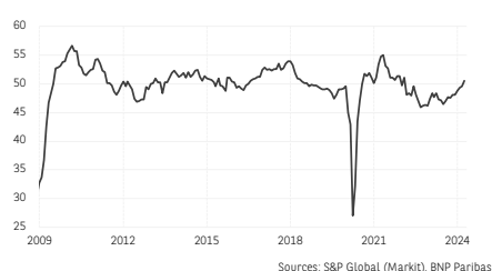
2. PMI manufacturier mondial Nouvelles commandes à l'exportation