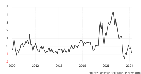
3. Indice synthétique de tensions sur les chaînes de valeur