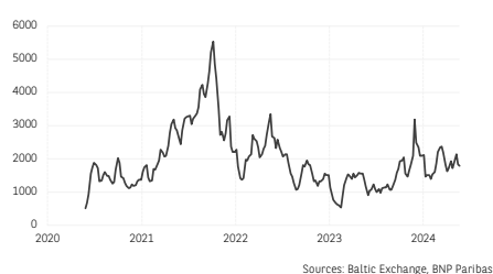
4. Baltic Exchange Dry Index