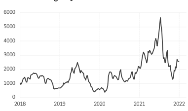
4. Baltic Exchange Dry Index