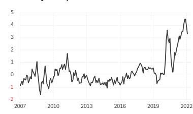
3. Indice synthétique de tensions sur les chaînes de valeur