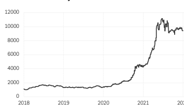
5. Indice du taux de fret