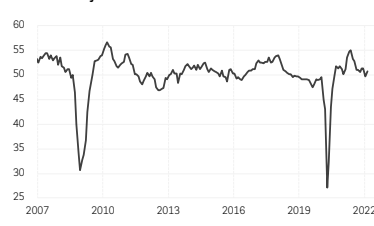
2. PMI manufacturier mondial - Nouvelles commandes à l'exportation