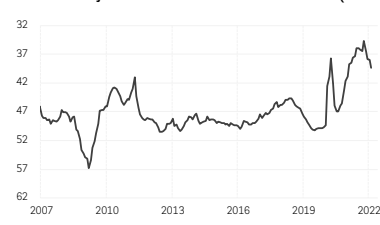
6. PMI manufacturier mondial - Délais de livraison (échelle inversée)